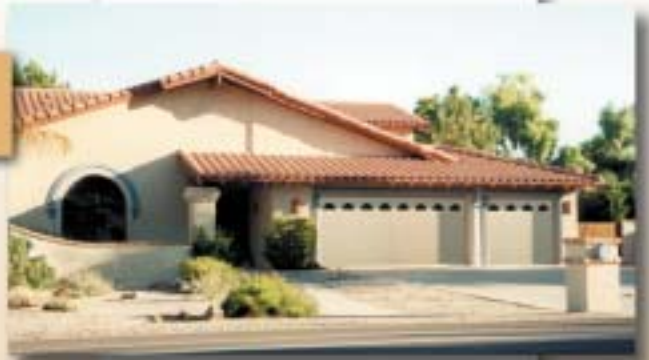
L25SP: Mostrado con tragaluces y paneles cortos opcionales estilo Cathedral.