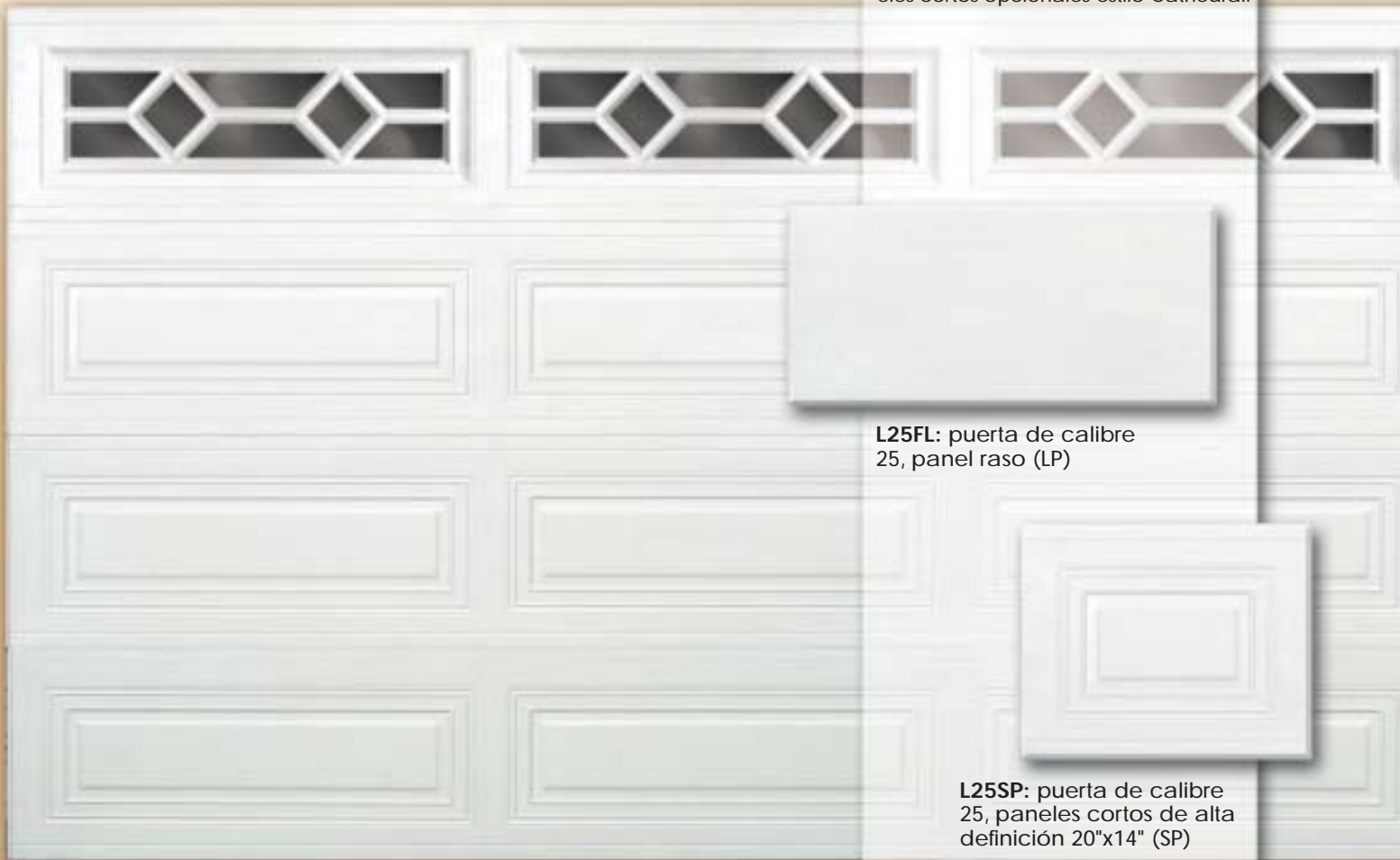
L25LP: puerta de calibre 25, paneles largos de alta definición 43"x14" (LP), Mostrado con tragaluces opcionales Diamond.