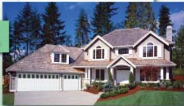
P23VP: Mostrado con tragaluces opcionales Plain View.