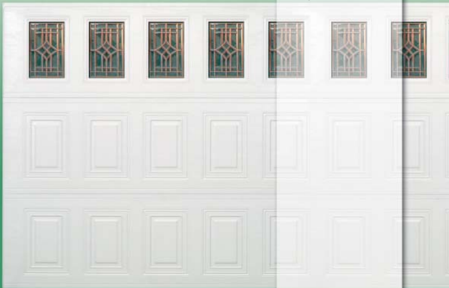
P23VP: Puerta de calibre 23 panel vertical. Mostrado con tragaluces opcionales Bevelite.

La puerta de garaje de panel vertical de la Serie Ponderosa introduce un estilo innovador y excitante. Paneles altos, verticales y repujados con líneas limpias y simples logrando una elegancia sorprendente y sin trabas. Textura repujada simulando madera, sistema integral de armazón reforzada RITS™, y diseños opcionales de ventanas parecidas a las ventanas de las casas modernas son tres de los toques finales de la Serie Ponderosa, la opción ideal para el cliente que desea una puerta con estilo que añade valor a una casa.